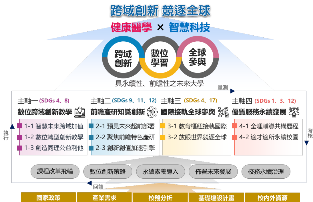
圖 1、中程校務發展計畫架構

因應全球化趨勢、產業與社會需求脈動、未來高等教育變革、聯合國教育願景，以及內部校務分析、互動關係人回饋，本校 111 年至 113 年中程校務發展計畫(如圖 1)，持續以『跨域創新 競逐全球』為總目標，除了對應的解決或增進方案外，更於進一步具體定調成以「跨域創新、數位學習、全球參與」為核心，發展成具永續性、前瞻性之未來大學，呼應『卓越教學、特色研究、國際接軌、優質服務』辦學目標，從教學、產研、國際、服務四主軸面向全面規劃推展教學與校務發展分項策略、子計畫及行動方針，促進校內外資源整合，以跨領域、跨文化、跨疆域的教學產研創新模式及教學數位轉型，作為全球教育的優質標竿。